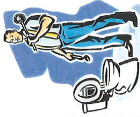
Código de la Ciudad pide que tiene que haber por lo menos un inodoro en buena condición de trabajo en cada vivienda.

• Deberá suministrar a cada unidad de vivienda este tipo de contenedores (contenedor para basura/carros para basura) que puedan ser necesarios para coleccionar toda la basura/desperdicios, y en todo tiempo los recipientes deberán estar en buenas condiciones de uso.